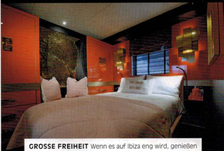
GROSSE FREIHEIT Wenn es auf Ibiza eng wird, genießen Gäste des „Floating Boutique Hotel Goldfinger“ den Vorteil der fließenden Platzwahl. Das 160 Quadratmeter große Luxushausboot kann seinen Mooringplatz in der Cappuccino Marina jederzeit verlassen, um ungebunden im Meer zu treiben. Ab 4200 €/Nacht inklusive Frühstück, Skipper, Concierge-Service; Hotelgoldfinger.com.

SCHLAU: DER TASCHEN- ANHÄNGER „ADERO“ GIBT LAUT, WENN NICHT ALLE ZUVOR MARKIERTEN OBJEKTE BEIM VERLASSEN DES HOTELS EINGEPACKT SIND. ADERO.COM